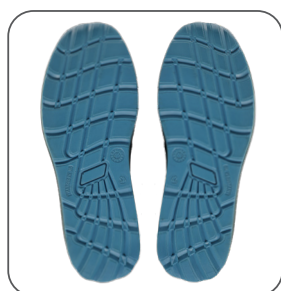
podešev outsole podeszwa